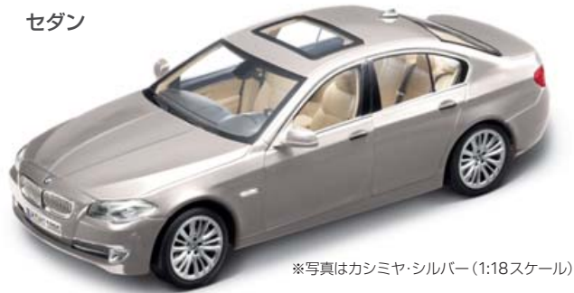
※写真はカシミア・シルバー (1:18スケール)