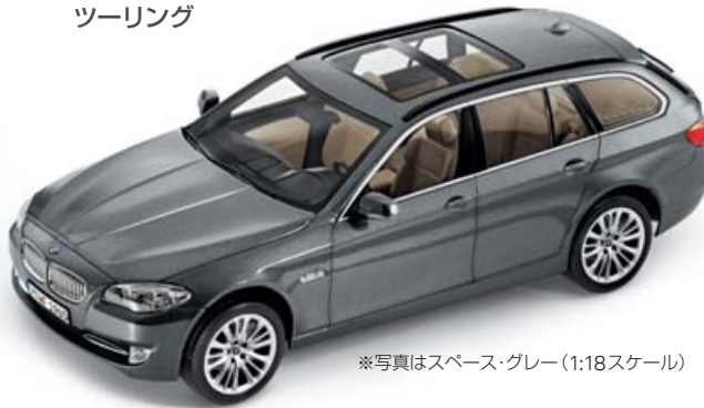
※写真はスペース・グレー (1:18スケール)